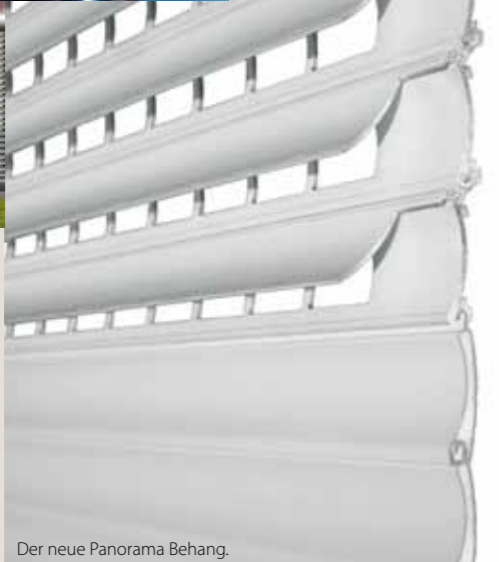
Der neue Panorama Behang.

Natürlich bieten sich Vorbaulösungen von FOLGNER an, Farbakzente in der Fassade zu setzen (5). Die fast unbegrenzte Farbauswahl eröffnet einen riesigen Gestaltungsspielraum.