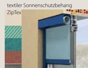
textiler Sonnenschutzbehang ZipTex

Vier verschiedene Behangarten mit jeweils unterschiedlichsten Oberflächen bieten für jeden Einsatzzweck die passende Lösung.