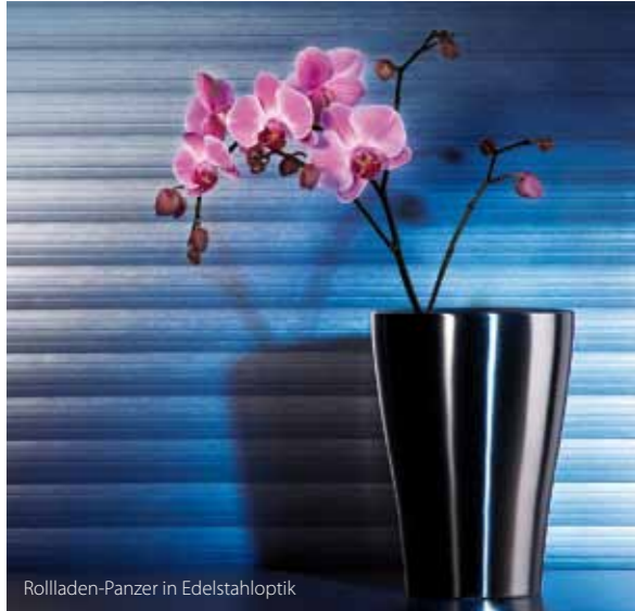
Rollladen-Panzer in Edelstahloptik